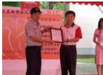
相片 23.95/5/15 賃居博覽會中方副校長頒發鼎山派出所感謝狀

為溝通對校外賃居生生活照顧及安全維護作法，由生輔組及校外賃居服務中心主辦、軍訓室協辦，於 95 年 9 月 25 日(週一)上午 10 時至 12 時 30 分，假國際會議廳舉行「賃居生股長講習座談會」，陸總教官親臨致詞，系輔導教官均到場指導，各班與會賃居生股長共 111 員。會中結合業務報告、Q&A、中心成員介紹、系聯絡員時間等，充分向學生幹部宣導應配合事項，為建立學生通訊正確資料及確保個人資料隱密性，詳細說明系統登錄方式，並請賃居生股長通知各班同學自行上網至校務系統更新，以利師長後續訪視作業，打造同學居住安全網；另為使學生能儘速修正通訊資料，前 10 名繳回班級通訊錄之賃居生股長，每人記 1 支嘉獎以資鼓勵。(相片 23-28)