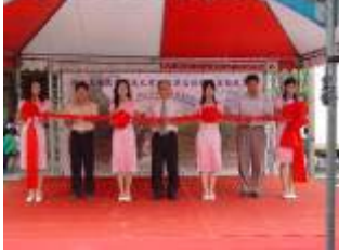
相片 33.10/25 「菸害防制週成果展」開幕式剪綵

10月25日12-13時開幕典禮由校長、副校長、學務長共同剪綵，生輔組長及所有教官均到場觀禮，現場有菸害防制才藝設計競賽優勝作品頒獎及展覽、反菸熱舞表演、成果展巡禮、菸害防制闖關遊戲及摸彩、菸害防制簽名連署、學生自製菸害防制宣導短片播放等。春暉社及進修推廣部慈暉社學生幹部精心設計之各項活動，使現場氣氛熱絡，參加人潮川流不息，而才藝競賽得獎同學對於能在開幕式中公開接受表揚、及作品裱框陳列展示，均感到無比榮耀。由參與活動師生絡繹不絕之盛況顯見已達到預期效果。(相片 33-36)