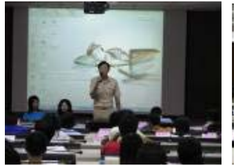
相片 27.9/25 陸總教官親臨會場致詞勉勵各班賃居生股長