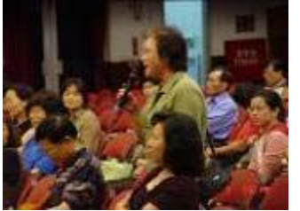
相片 26.95/4/3 房東座談會中房東提出問題