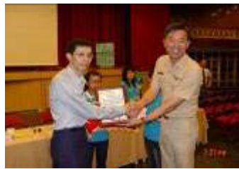
相片 25.95/4/3 房東座談會中致贈鼎山派出所感謝狀