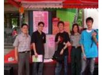
相片 24.95/5/15 賃居博覽會「一元競標」得標者與教官合影