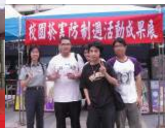
相片 36.10/25 「菸害防制週成果展」周教官和參與活動學生合影