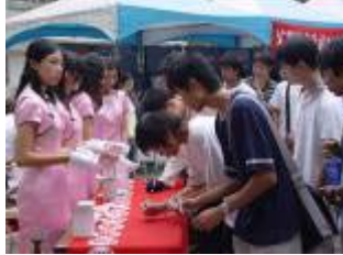
相片 34.10/25 「菸害防制週成果展」師生踴躍支持反菸簽名活動