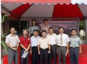
相片 35.10/25 「菸害防制週成果展」參與開幕式師長合影