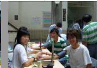
相片 22.本校與育英春暉社合辦「健康快樂反五毒」活動